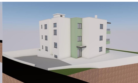
TLOUKY 1. KATA