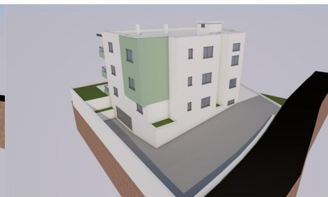
TLOUKČI 1. KATA