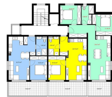
42,08 m 2 + balkon 42,07 m 2 + balkon 42,20 m 2 + balkon