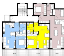
42,08 m 2 + balkon 42,07 m 2 + balkon 50,51 m 2 + balkon