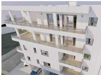
PRIZEMLJE- APARTMAN S1