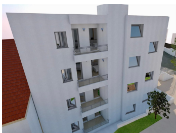
1 KAT- APARTMAN S4