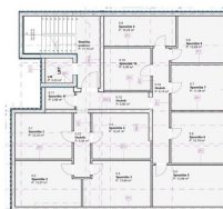
2.KAT 2nd FLOOR