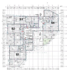
PRIZEMLJE GROUND FLOOR