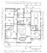
1. ANDO PRIZEMIE